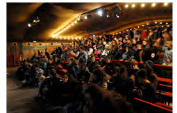
Photos, de g à d : 1 et 2 – au MK2 Quai de Seine ; 3 – au Forum des images ; 4 - au Grand Parquet