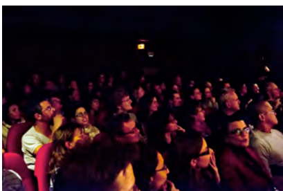
Le public de L'Entrepôt

> Jeudi 15 novembre à 20h le cinéma L'Entrepôt a fait salle comble (208 entrées) lors de deux projections successives sur le thème « Jeunes sourds dans la société ».